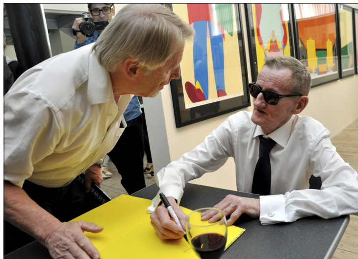
I GALLERIET: Pushwagner signert bøker og tegnet til alle han møtte under åpningen i Telemarksgalleriet.